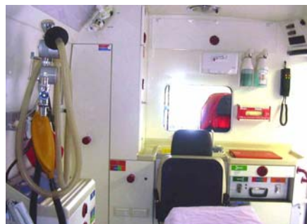
Blick auf die Inneneinrichtung der RTW 2

An dieser Stelle möchte ich mich bei allen Rettungsdienstlerinnen und Rettungsdienstlern für das Engagement und die geleistete Arbeit bedanken. Dies ist nicht selbstverständlich schon deshalb erwähnenswert.