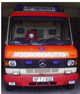
RTW 2 (Johannes GP 3/83-1)

Checklisten sorgen für die vollständige und dauerhaft einheitliche Ausrüstung beider Fahrzeuge. Nur so ist gewährleistet, dass bei jeder Fahrzeugübernahme sichergestellt ist, dass alles an Bord ist und funktioniert. Aus dem Gedächtnis heraus geht ein Fahrzeugcheck heute nicht mehr, wir haben über 300 verschiedene Verbrauchsmaterialien und medizinisches Gerät im Fahrzeug.