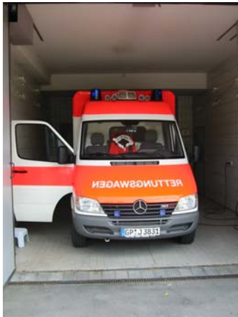
Neuer Rettungswagen (vorne)

Der neue RTW ist nun ein Jahr im Einsatz und hat sich bewährt. Damit die vorgeschriebenen Grundreinigungen des Fahrzeugs durchgeführt werden können und der 2. RTW weiter „in Schuss“ bleibt, wird alle 5 Wochen mit dem 2. RTW Rettungsdienst gefahren. Beide RTWs sind identisch ausgestattet und ohne Einschränkungen einsatzbereit.