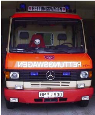
Alter RTW (jetzt RTW 2)

Der RTW wird dann als Ersatzfahrzeug weiterhin im Einsatz sein. Die Ausstattung beider Rettungswagen ist identisch, so dass beide voll einsatzklar sind.