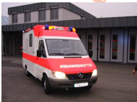
Neuer Rettungswagen (vorne)

Danach wurden alle Helferinnen und Helfer auf dem neuen Fahrzeug eingewiesen. Seit Februar 2002 fahren wir mit dem neuen RTW.